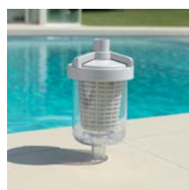
Piège à feuilles