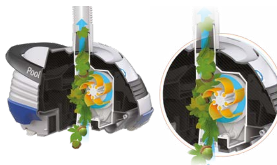
Technologie brevetée V Flex® : turbine à pales mobiles pour capturer les gros débris

Le design de ses ailes améliore l'aspiration de toutes sortes de débris