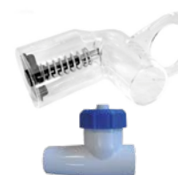
Dépressiomètre et vanne de réglage