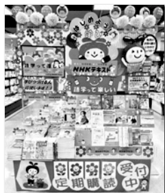
くまの書店 宇都宮店様 榎木忠