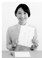
大江静芳 おおえ・せいほう 書道家