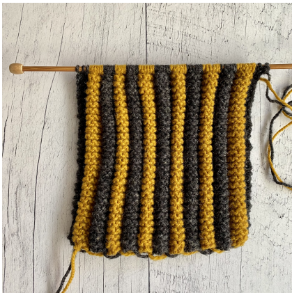
Endroit du travail - les boudins se forment

Répéter ces 2 rangs jusqu'à ce que la pantoufle mesure la longueur désirée, selon le pied. Arrêter lorsque vous arrivez au bout du petit orteil.