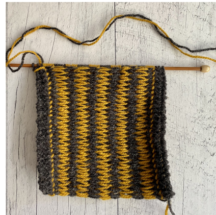
Envers du travail - les fils se croisent