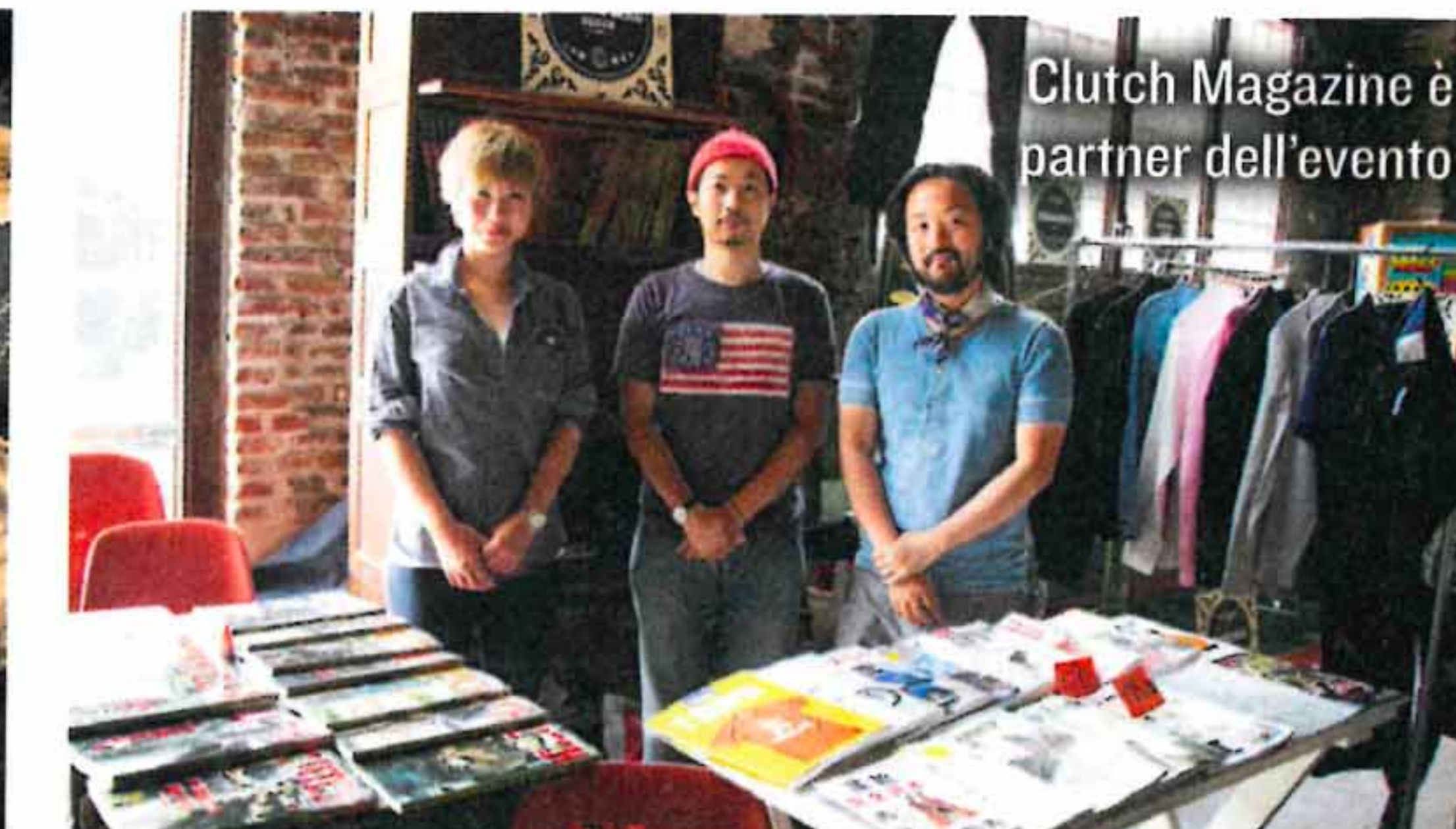
Clutch Magazine è partner dell'evento