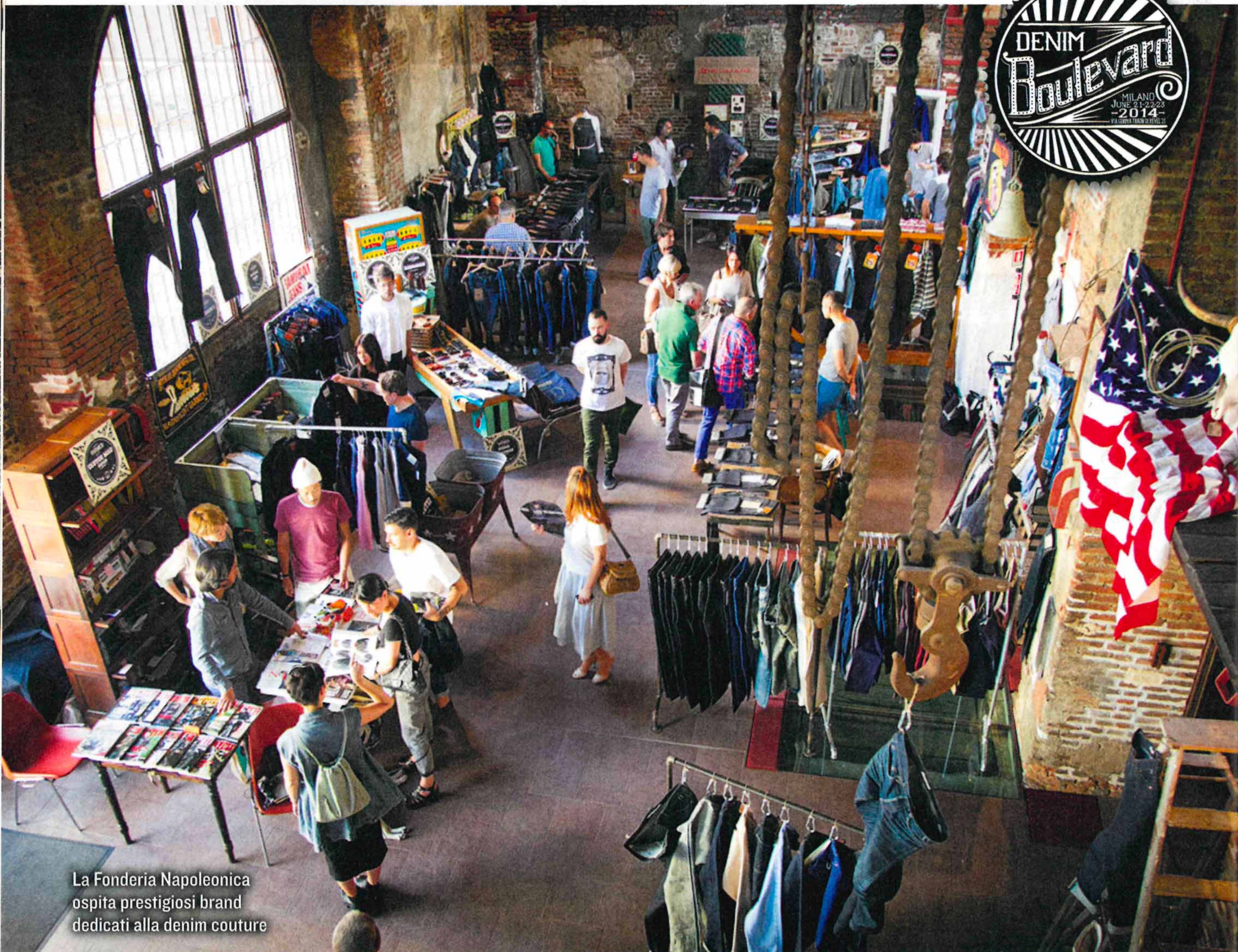
La Fonderia Napoleonica ospita prestigiosi brand dedicati alla denim couture

In occasione della settimana della moda uomo di Milano si ripete la tre giorni dedicata al tessuto più famoso e indossato al mondo. Coinvolge nel quartiere Isola un pubblico variegato con mostre, workshop, dimostrazioni e musica live... testo Luigi Zanolli