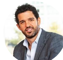
Oso Trava Creador de Cracks Podcast y operador de Cracks Fund