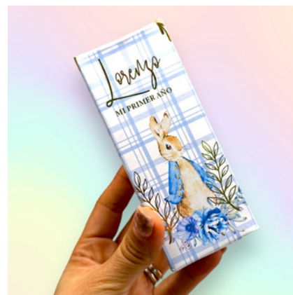
Caja Jugo Full Print

12 a 19 $4.3 USD c/u 20 o más $3.7 USD c/u