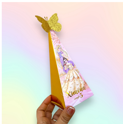
Pirámide Base metálica

Empaques personalizados. El diseño para todos los empaques es igual, incluye efecto metálico en el nombre. Las cajas se entregan vacías y listas para que puedas llenarlas con dulces o contenido de tu elección. Se entregan desarmadas para optimizar espacio en el envío.