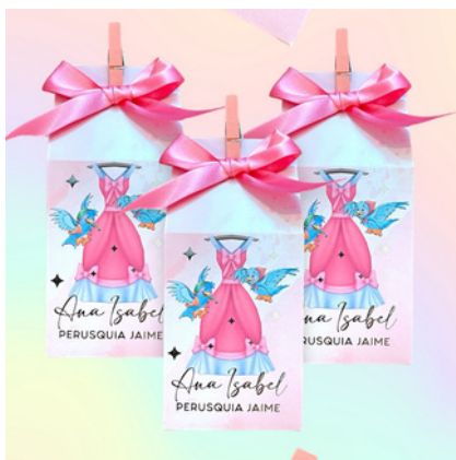
Milk Box Full Print

12 a 19 $4.3 USD c/u 20 o más $3.7 USD c/u