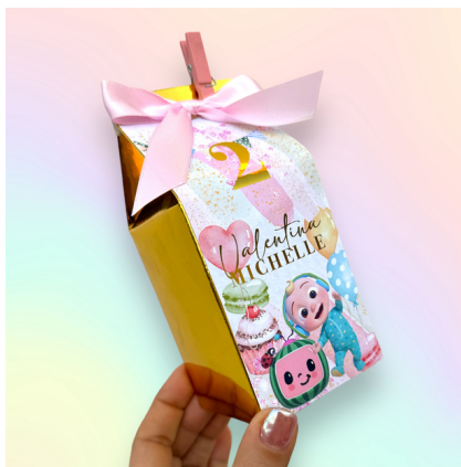
Milk Box Base metálica

12 a 19 $3.7 USD c/u 20 o más $3.1 USD c/u