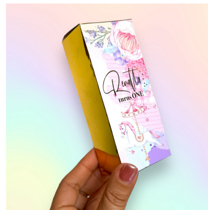
Caja Jugo Base metálica

12 a 19 $3.7 USD c/u 20 o más $3.1 USD c/u