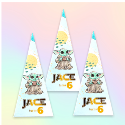
Pirámide Full Print

12 a 19 $3.5 USD c/u 20 o más $2.9 USD c/u