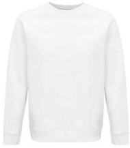
Sol's - Space