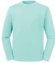
Rusell - 208M