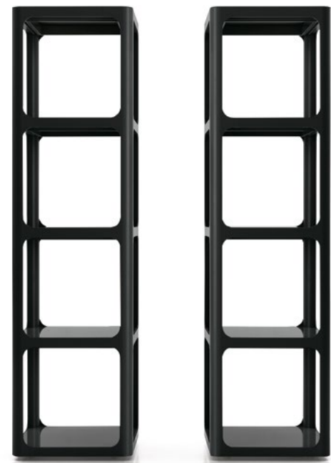
Struttura Structure : 13 nero Vetro Glass : 46 nero lucido W 440 H 1660 D 440