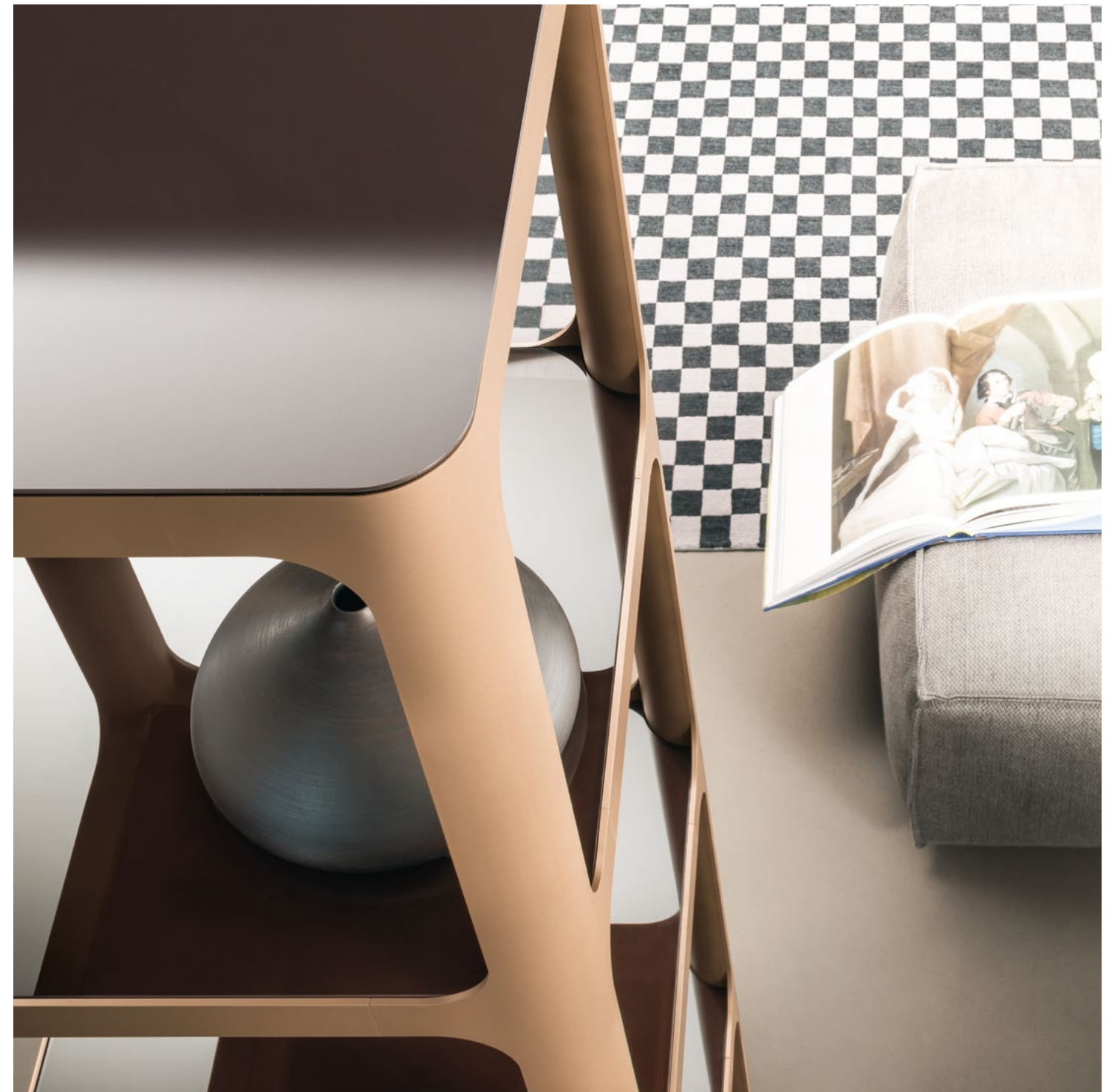
Struttura Structure : 300 rame Vetro Glass : 75 amaranzo lucido