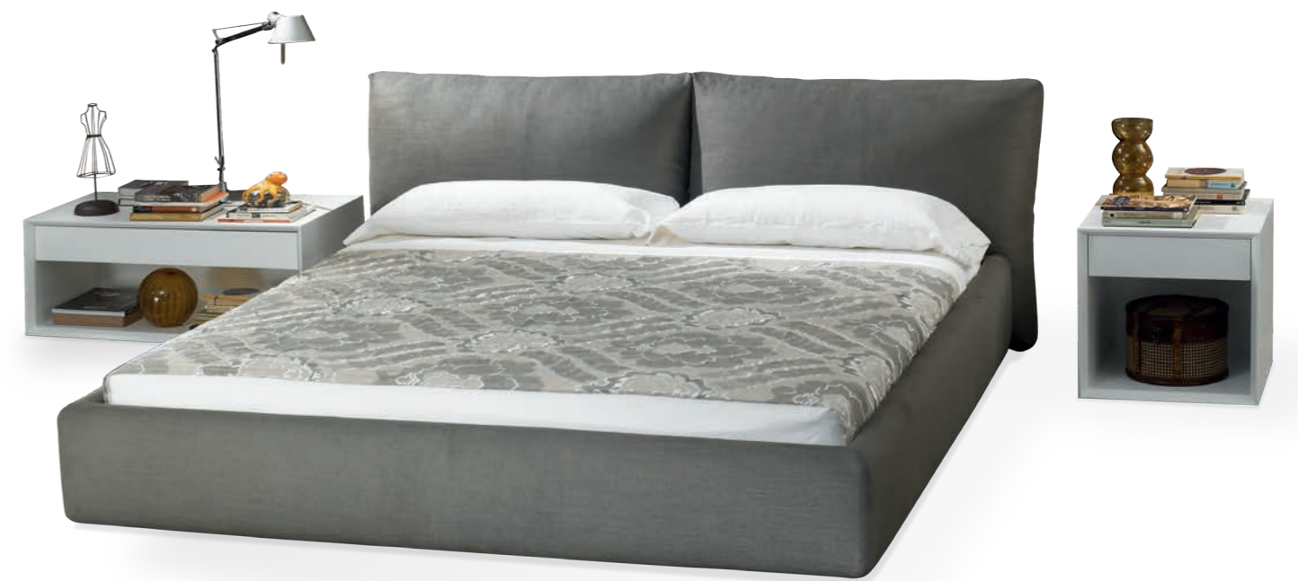
Form features colour coordinated rear tubular structural supports for the selected fabric