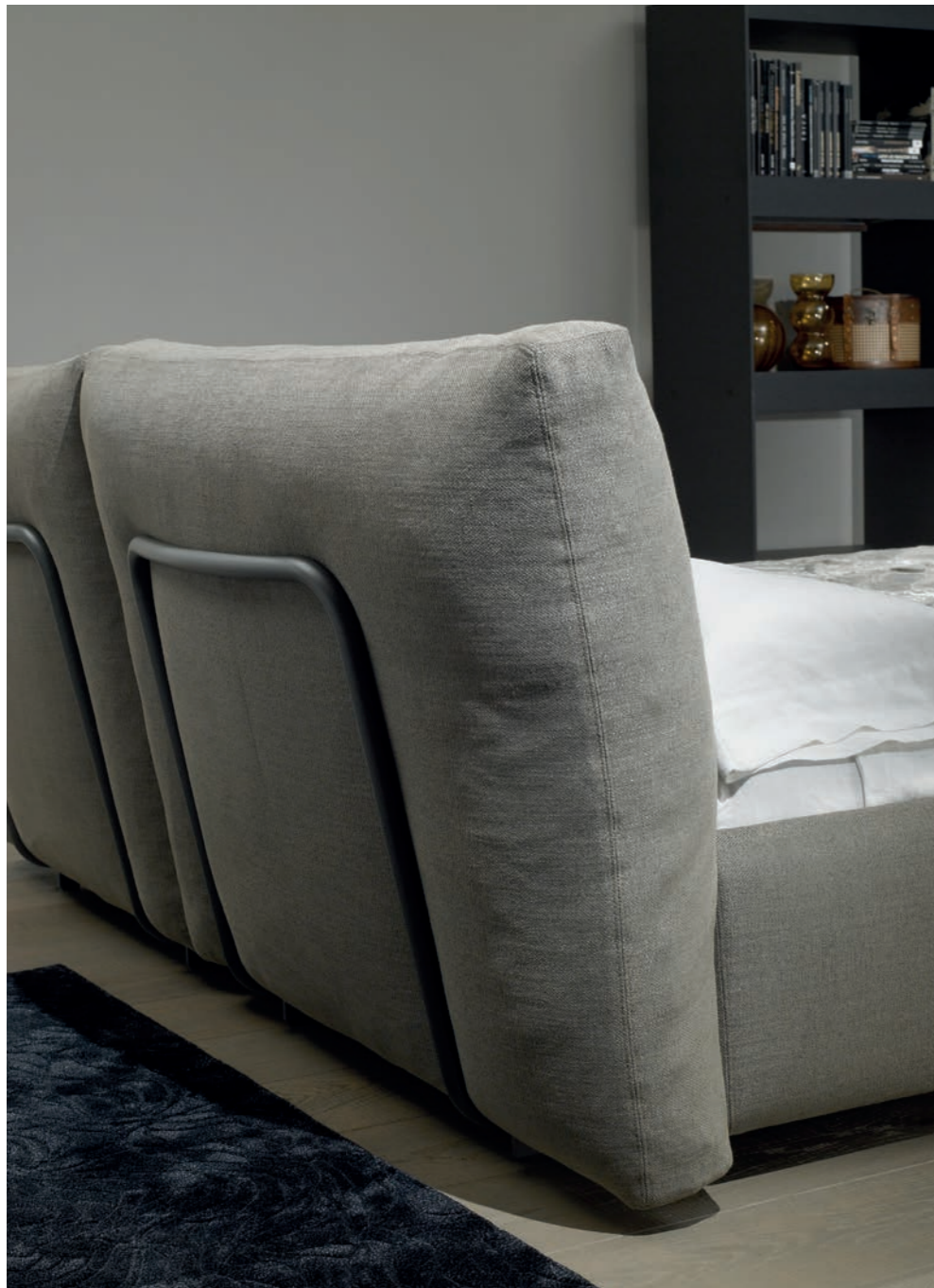
Dali permite coordinar el color de la estructura tubular posterior con el color del tejido seleccionado