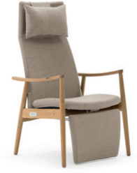
Nordia mit Fußstütze