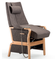
Duun Motorisierter Sitz