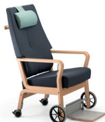
Duun mit Rädern