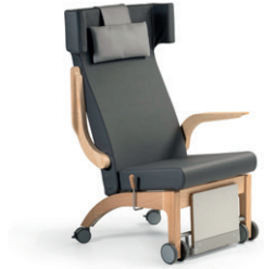
Fjording mit Rädern