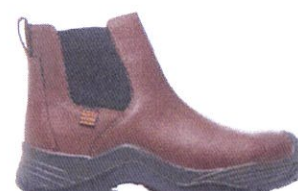
NEW DENVER TERRAIN

Grupo 193 categoría de protección: S3 CI HI SRC