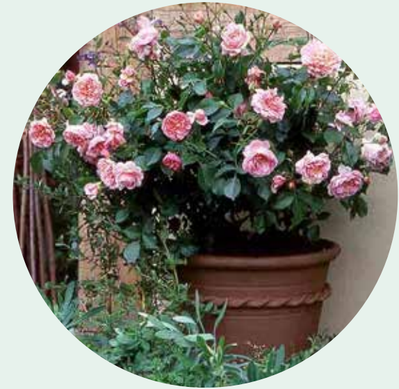
• Engelse roos in een grote terracotta pot

Het is een geweldig rijk gezicht, rozen in grote potten op een terras. Kies voor geurende rozen en plaats deze bij de entree en je geniet telkens van het parfum. Gebruik potten van minimaal 45 centimeter breed en diep. Geef de rozen bij warm weer dagelijks