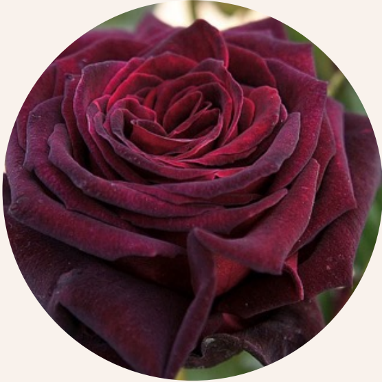
• Rosa Black Baccara (Meiland, 2000)