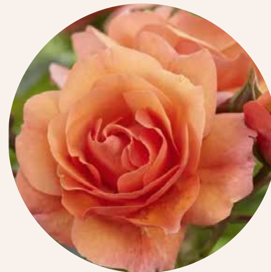
• Rosa Aprikola (Kordes, 2003)