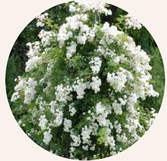
• Rosa Groei & Bloei (Marco Braun, 2015)

Tip: vind je het zonde om bloemen die nog niet helemaal zijn uitgebloeid af te knippen en sta je met pijn in je hart te wikken en wegen? Zet ze dan binnen in een vaas om er nog even van te kunnen genieten. Knip de rozen op verschillende hoogten af en combineer verschillende soorten met elkaar. Ze zijn vrij snel uitgebloeid maar geven een veel natuurlijker beeld dan rozen van de bloemist.