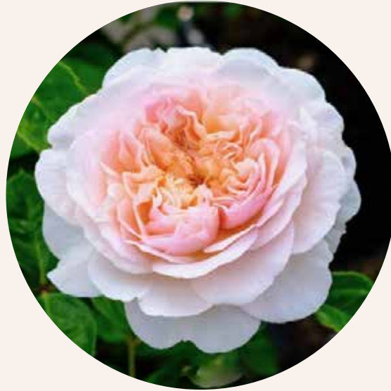
• Rosa Emily Brontë (Austin, 2018)

Doorbloeiende rozen zullen op deze manier nieuwe bloemen blijven maken tot aan de herfst. Extra voeding helpt de roos hierbij. Je mag daarom tijdens de zomer tot september na elke bloei een beetje voeding blijven geven.