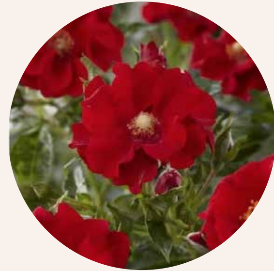
• Rosa Alpengluhen (Tantau, 2005)