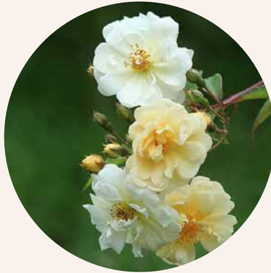
• Rosa Belle Epoque Yellow Rambler