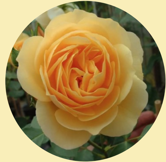
• Engelse roos Graham Thomas (David Austin, 1983)