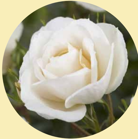
• Moderne roos Lions Rose (Kordes, 2004)