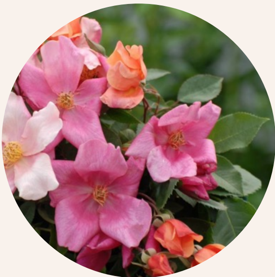
• Rosa Mutabilis (onbekend)