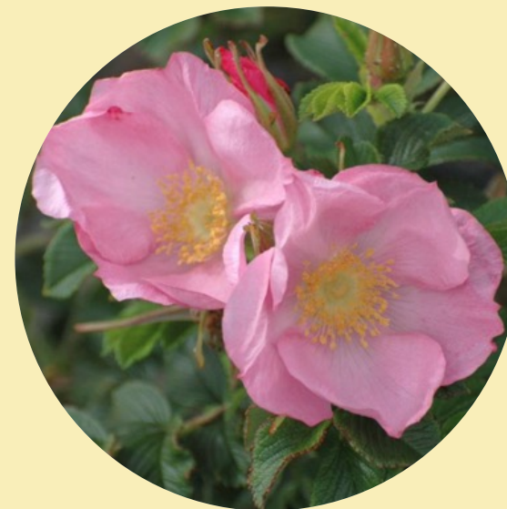
• Wilde roos Dagmar Hastrup (Muller,1901)

Wilde rozen worden ook botanische rozen genoemd. Het zijn sterke soorten die vaak eenmalig bloeien en in het najaar prachtig gekleurde bottels geven. Wilde rozen hebben een natuurlijke schoonheid met kleine bloemetjes die vaak roze of wit zijn. Het zijn sterke planten en vaak snelle groeiers. Wilde rozen komen oorspronkelijk uit Noord Europa en zijn daardoor goed geschikt voor ons (veranderende) klimaat.