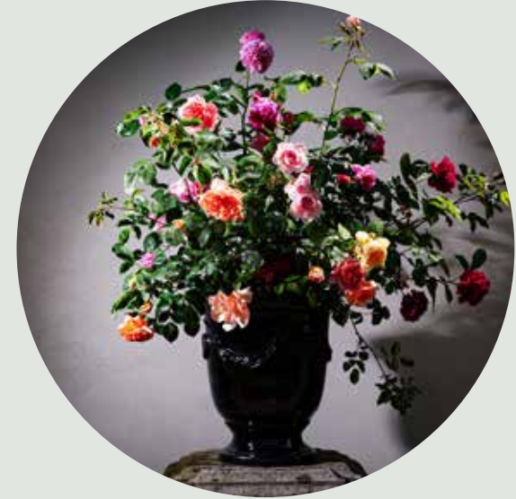
• Combineer verschillende soorten rozen in een grote pot

Plant de rambler op voldoende afstand van de boom, minimaal een halve meter. Dit om de roos de noodzakelijke voedingsstoffen uit de bodem te kunnen laten halen. Plant de roos aan de zonzijde en leidt deze naar de stam.