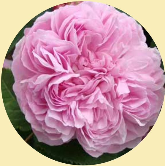
• Oude roos Jacques Cartier (Moreau Robert, 1868)