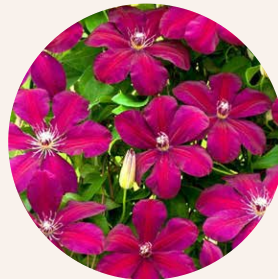
• Clematis Rouge Cardinal