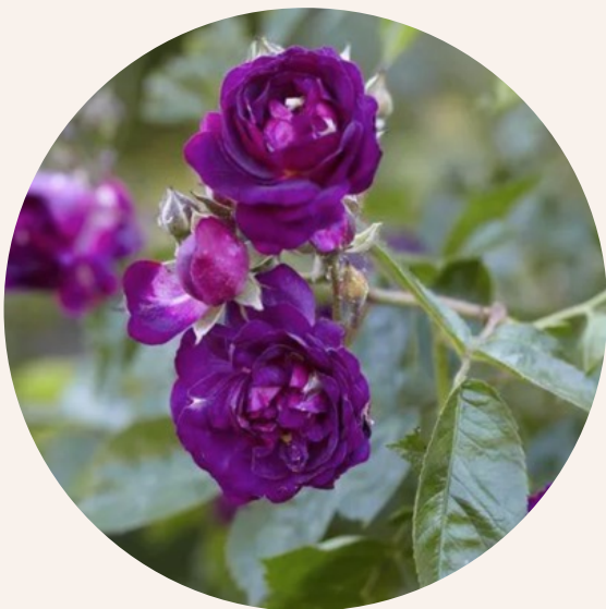
• Rosa Bleu Magenta (Grandes Roseaies du Val de Loire 1933)