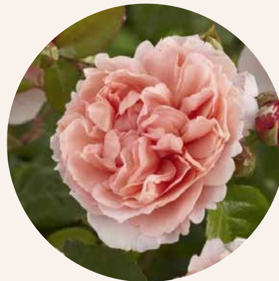
• Rosa Strawberry Hill (Austin, 2006)

Doorbloeiende klimrozen snoeien tijdens het seizoen. Doorbloeiende klimrozen snoei je na de eerste bloei. Door de uitgebloeide roos af te knippen voorkom je dat de roos rozenbottels aanmaakt en ontstaat er een nieuwe bloem. Dit herhaal je tijdens het seizoen om telkens nieuwe bloei te laten ontstaan. Geef de roos extra voeding na de eerste bloei.