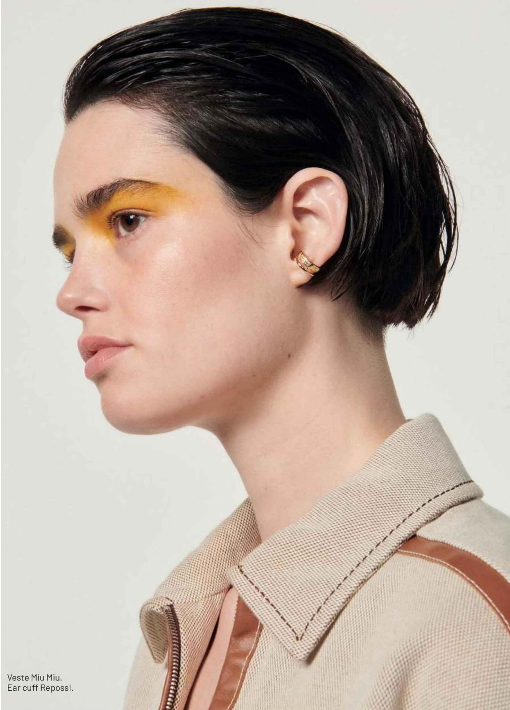
Veste Miu Miu. Ear cuff Reposi.