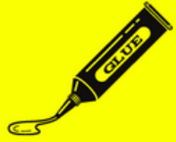
Colle à Papier Peint