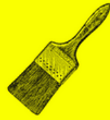
Pinceau à Colle