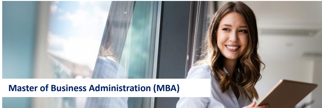
Master of Business Administration (MBA)

Dein Weg zu persönlicher und beruflicher Weiterentwicklung geht bei uns weiter – gestalte deine Zukunft aktiv und erfolgreich!