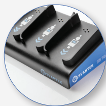
SB 104B-5 Estación de carga 5 dosímetros