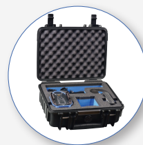
SA 147 Maleta de transporte intemperie para 1 dosímetro y 1 estación de carga sencilla