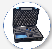
SA 147 Maleta de transporte intemperie para 5 dosímetros y 1 estación de carga múltiple