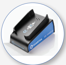
SB 104B-1 Estación de carga para 1 dosímetro