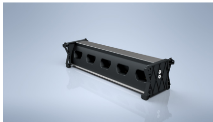
Utilice únicamente el cargador 5WSSC P / N: 7177214 en combinación.

Vincula hasta 4 unidades con el cable (opcional) de enlace (7177215). Conectar desde el puerto de salida al puerto de entrada de la segunda base.