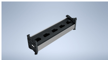
También es posible hacia arriba