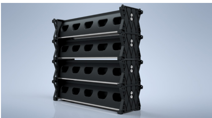
Hasta cuatro cargadores apilables