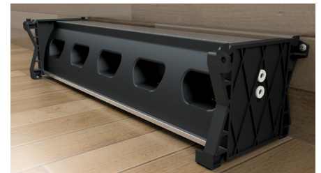
Monte la base de carga en el escritorio o la pared usando tornillos recomendados de montaje de 4,8 mm