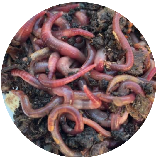
MINHOCAS DA ESPÉCIE CALIFORNIANA