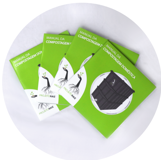
MANUAIS INSTRUÇÕES E DÚVIDAS FREQUENTES