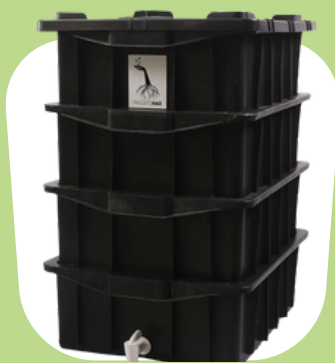
3 Kits Médios