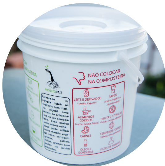
LIXEIRINHA DE COMPOSTAGEM ADESIVADA