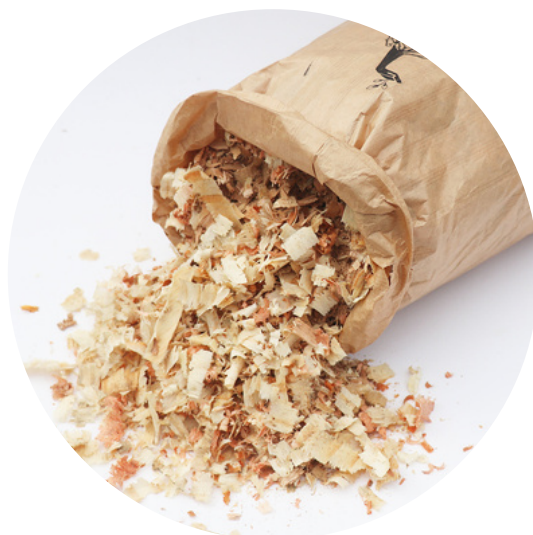
SERRAGEM APROXIMADAMENTE 800G