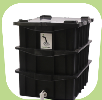
4 Kits Pequenos