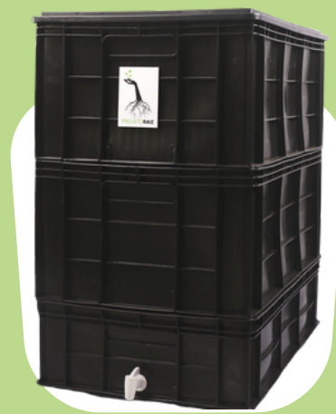
3 Kits Grandes