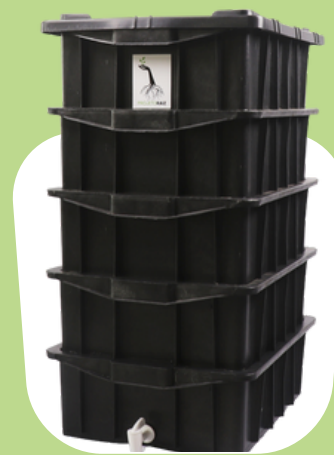
1 Kit Médio Plus