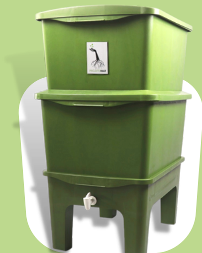
3 Kits Humis