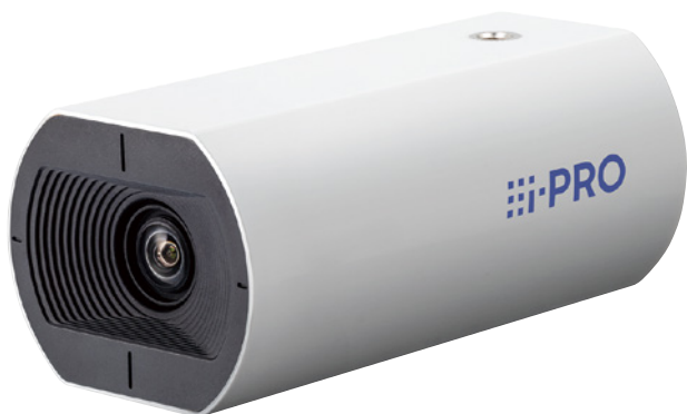
WV-U1142A (バリフォーカル) WV-U1132A (バリフォーカル)