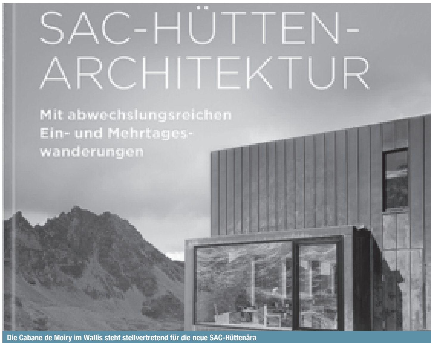
Die Cabane de Moiry im Wallis steht stellvertretend für die neue SAC-Hüttenära

gendeiner Bergspitze Rast machen, sondern seien oft das eigentliche Ziel der Wanderung. Zettels Werk beschreibt 24 SAC-Hütten. Alte, kaum sanierte Gebäude finden darin ebenso Platz wie An- und Nebenbauten und futuristisch anmutende Neubauten. Kombiniert mit Ein- oder Mehrtagestouren werden sie