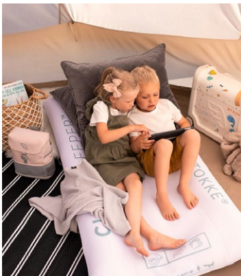
Der «Cloud Sleeper» von Stokke kostet Fr. 109.– und ist im Fachhandel oder bei stokke.com erhältlich.

Falls Sie jetzt denken: Na ja, eine Luftmatratze bekomme ich günstiger. Stimmt. Doch die Luftkissen des «Cloud Sleeper» sind an den Längsrändern grösser, damit die Kids nicht vom Bett ( 150 x 75 x 17 cm ) rutschen. Was zusätzlich auch noch vom Netzgewebe auf der Oberseite der Matratze verhindert wird. Damit punkten normale Luftmatratzen nicht. Praktisch ist auch, dass sich die Matratze, die eine Last bis 68 kg aushält, wieder einfach in die mitgelieferte Tasche (38 x 28 x 10 cm) verstauen lässt und nur 1,4 kg wiegt. Sonja Hüslér