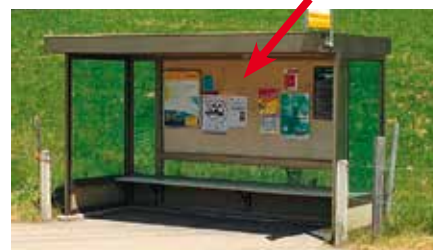
Aeschstrasse, in Bushaltestelle Bühlen