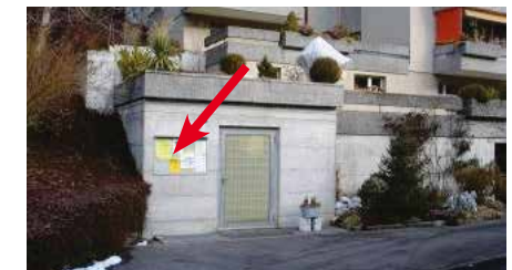
Bürgstrasse Nr. 23, an BKW Trafostation