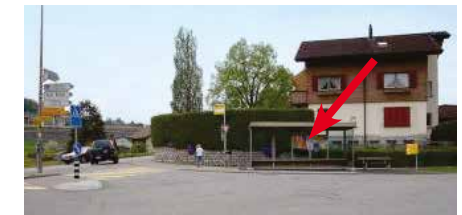
Bürg, in Bushaltestelle, Einmündung Schachenstrasse