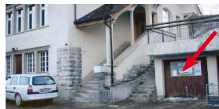
Aeschstrasse, an Garagentor beim Schulhaus