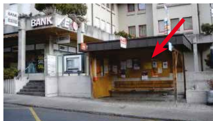
Oberlandstrasse 9, vor AEK in Bushaltestelle