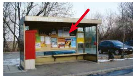
Spiezstrasse, Bushaltestelle Deltapark, (seeseitig)