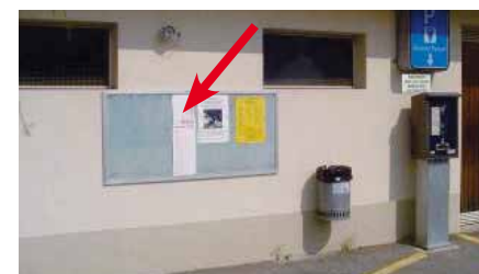
Gebäude Pumpwerk, Parkplatz Dorf (Tenne)