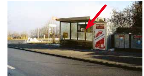
Krattigstrasse, in Bushaltestelle, Einmündung Aeschiweg