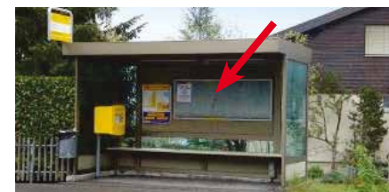
Hondrichstrasse, in Bushaltestelle Stutz (Moos)