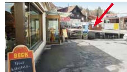
Spiezstrasse, vor Bäckerei Linder, Gwatt