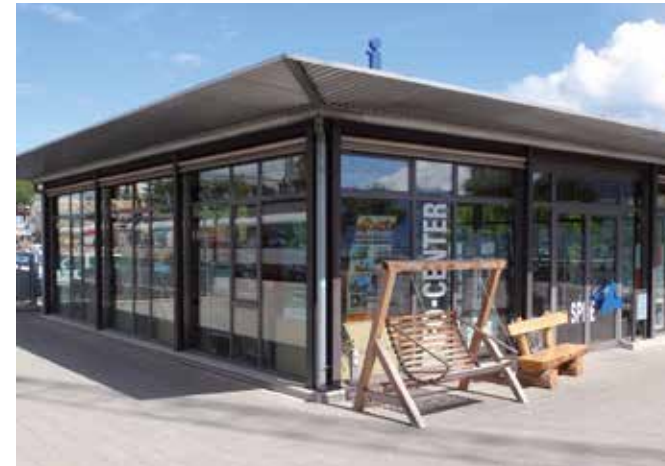
Tageskarten sind im Info-Center am Bahnhof erhältlich.

Viele Anfragen betreffend der Tageskarten gelangen an die Gemeindeverwaltung. Die Tageskarten sind aber nicht bei der Gemeinde, sondern ausschliesslich beim Info-Center Spiez der Spiez Marketing AG am Bahnhof erhältlich.