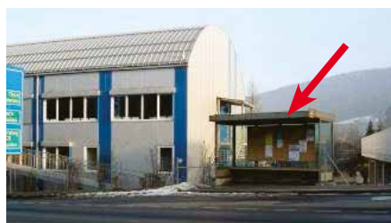
Simmentalstrasse, in Bushaltestelle unterhalb Passarelle