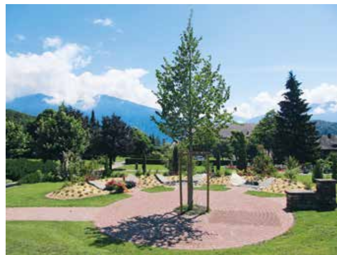
Neues Gemeinschaftsgrab auf dem Friedhof Spiez

Auf dem Friedhof Spiez steht seit Anfang Jahr unmittelbar zwischen dem bisherigen Gemeinschaftsgrab und dem Soldatendenkmal ein neues Gemeinschaftsgrab.