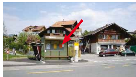
Thunstrasse, in Bushaltestelle, Einmündung Werkstrasse