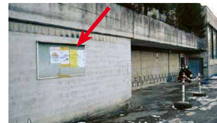
Höhenstrasse, an Mauer beim Schulhaus Roggern