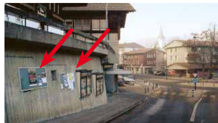
Seestrasse, Kronenplatz, an Stützmauer