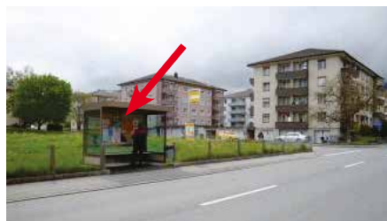
Simmentalstrasse, in Bushaltestelle Neumatte