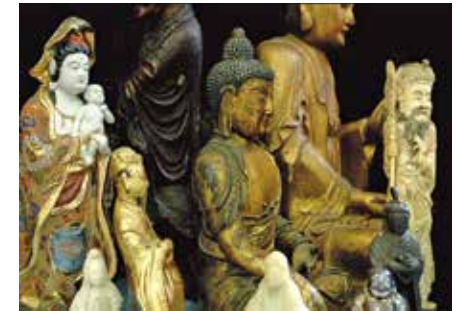
Skulpturen aus China, Sammlung Walter Rieder, Kunsthaus Interlaken

Über 50 zum Teil grossformatige Zeichnungen von vier Künstlern und Professoren der Kunsthochschule in Nanjing bilden den Schwerpunkt der Ausstellung. Die Arbeiten, die im letzten Sommer in Habkern entstanden sind, zeugen von tiefem Einfühlungsvermögen und aussergewöhnlich hoher Fertigkeit in der sehr alten chinesischen Technik der Tusch-Malerei.