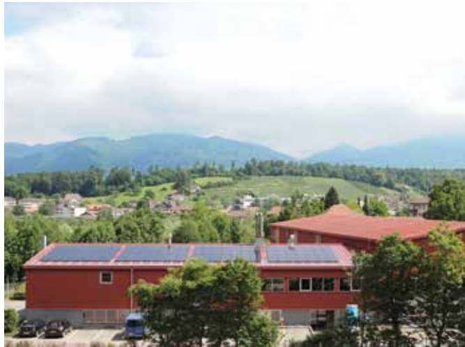
112 Panels à 290 Watt = 34,48kWp = 32'000kWh/Jahr

Die Sonnenkönige von Spiez. Eine aktive Genossenschaft und eine engagierte Gemeinde.