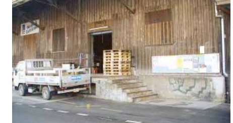
Bahnhofstrasse Nr. 6, ehem. Brennstoffe/Getränke Rubin AG