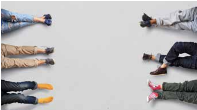
Jugendliche warten auf Ihr Inserat. Beschäftigen Sie diese Füsse auch in den Sommerferien!

Welche Betriebe, Institutionen oder Haushalte können sinnvolle Zusatzverdienste zum Taschengeld anbieten? Gesucht werden Wochenplätze und Ferienjobs.