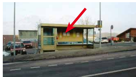
Frutigenstrasse, in Bushaltestelle beim Restaurant Rössli