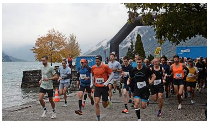
Mit Vollgas voraus: Start des Feldes in Brienz.

Die Siegerliste des Brienzerseeelaufs geht bis ins Jahr 1956 zurück, ab 1986 war die Strecke genau 35 Kilometer lang und führte rund um den Brienzersee. Seit letztem Jahr wird die Sieger- und Siegerinnen-Geschichte neu geschrieben; der Lauf geht nur halb um den Brienzersee, auf der Giessbach-Seite. «Die Strecke