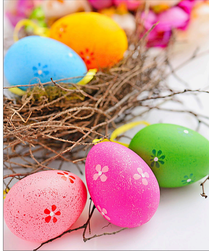
Der Fantasie sind keine Grenzen gesetzt.