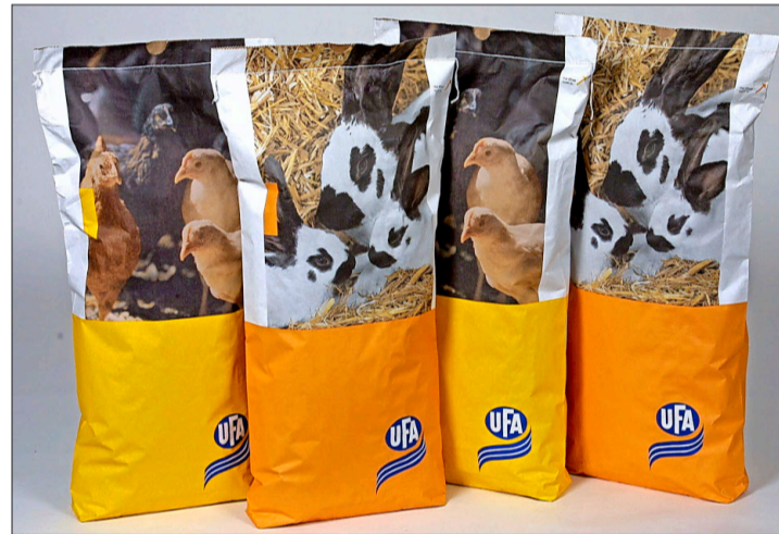
Als Hauptpreis winkt UFA-Futter für Huhn und Kaninchen!