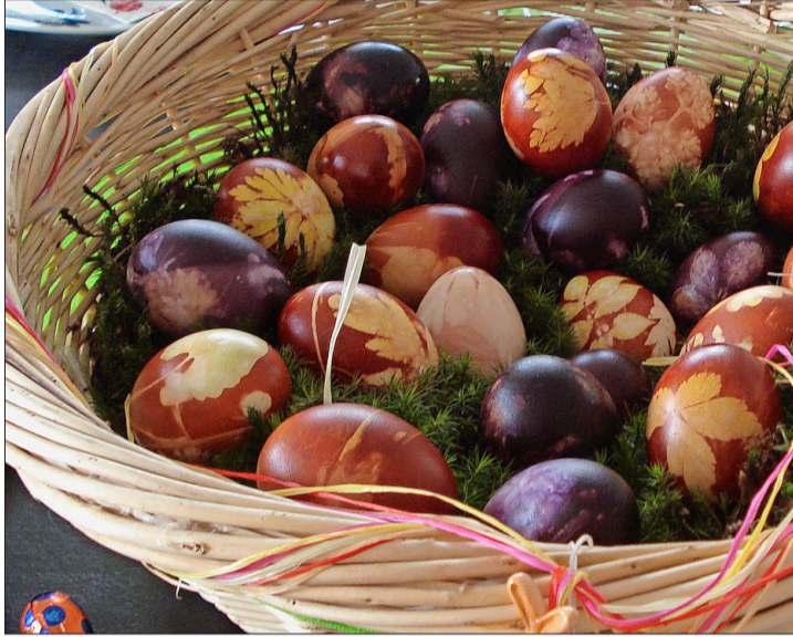
Natürlich gefärbte Ostereier sind Tradition.

Die wunderschönen selbst gefärbten Ostereier möchte man am liebsten heil lassen, anstatt die Kunstwerke später zu essen. Weshalb sie also nicht fotografisch festhalten? Und gleich ein Foto des schönsten Eis an wettbewerb@schweizerbauer.ch schicken. Denn der «Schweizer Bauer» sucht die schönsten Ostereier der Leserinnen und Leser. Damit auch Kinder eine Chance haben,