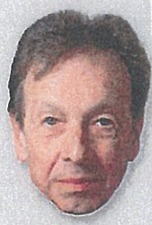
PHILIPPE JACCOTTET PUBLIABLE