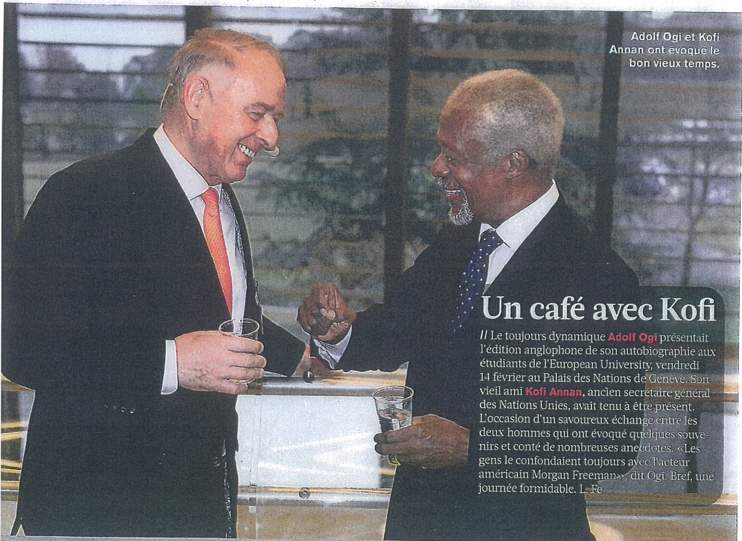
Adolf Ogi et Kofi Annan ont évoqué le bon vieux temps.