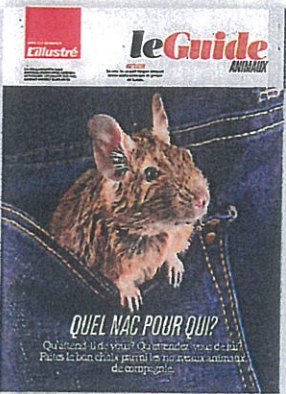
53 Tout savoir sur les NAC.