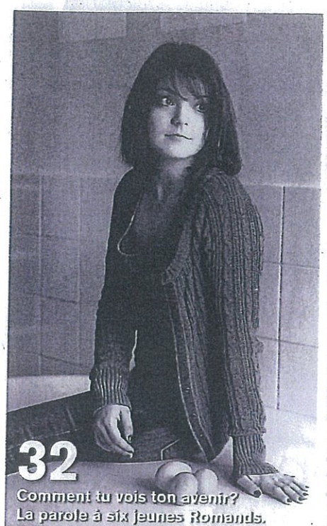
32 Comment tu vois ton avenir? La parole à six jeunes Romands.