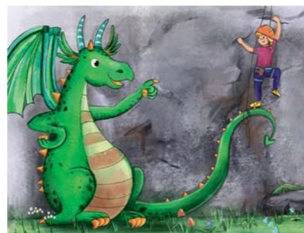
«Bubu, der Kletterdrache»: Abenteuer im Berner Oberland!

der Winter nähert sich und zwingt die Störche zum Flug in den Süden. Auf dem Weg sieht Marius viel Schönes, aber auch viel Zerstörung. Dana Grigorcea schafft es, Themen wie Migration und Umweltverschmutzung sensibel und kindergerecht anzusprechen.