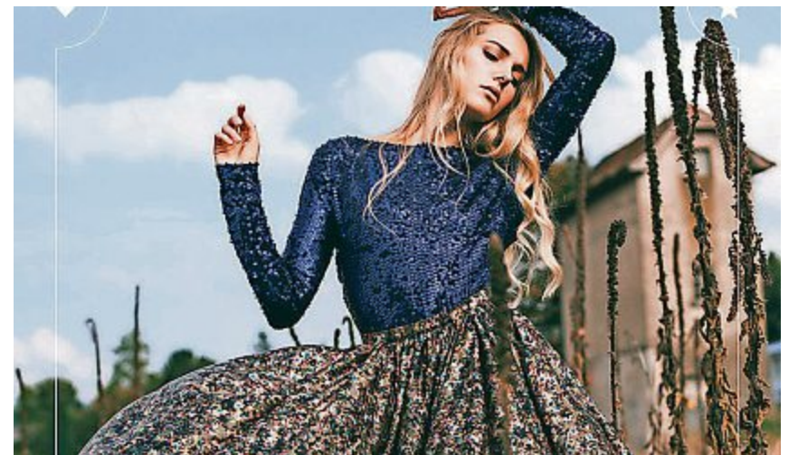
Dank dem Adventskalender ist Couture Shopping doppelt schön.