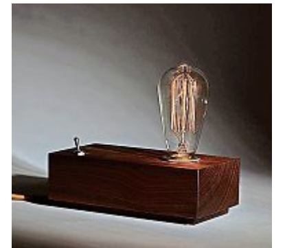
Die Leuchte «Daisy» aus edlem Holz. z.Vg.