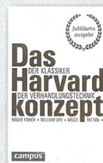
Diverse Autoren «Das Harvard-Konzept» Campus Verlag, 288 Seiten, broschiert ISBN 978-3-593-50145-1, CHF 39.90