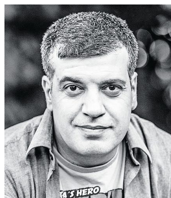
Schriftsteller Sayed Kashua.

Die Ehe von Said mit Falestin in den USA läuft aber schlecht. Finanziell hängt Said von seiner Frau ab: Hier bekommt er keine Aufträge mehr, fern von seinen Fake-Memoiren-Kunden. Nirgendes Halt. Fiebrig erfindet Said an Vaters Spitalbett eine glückliche Kindheit. Es hält nicht vor. «Ich habe all meine schönen Erinnerungen an meine Kunden geschenkt, bis sie alle waren und