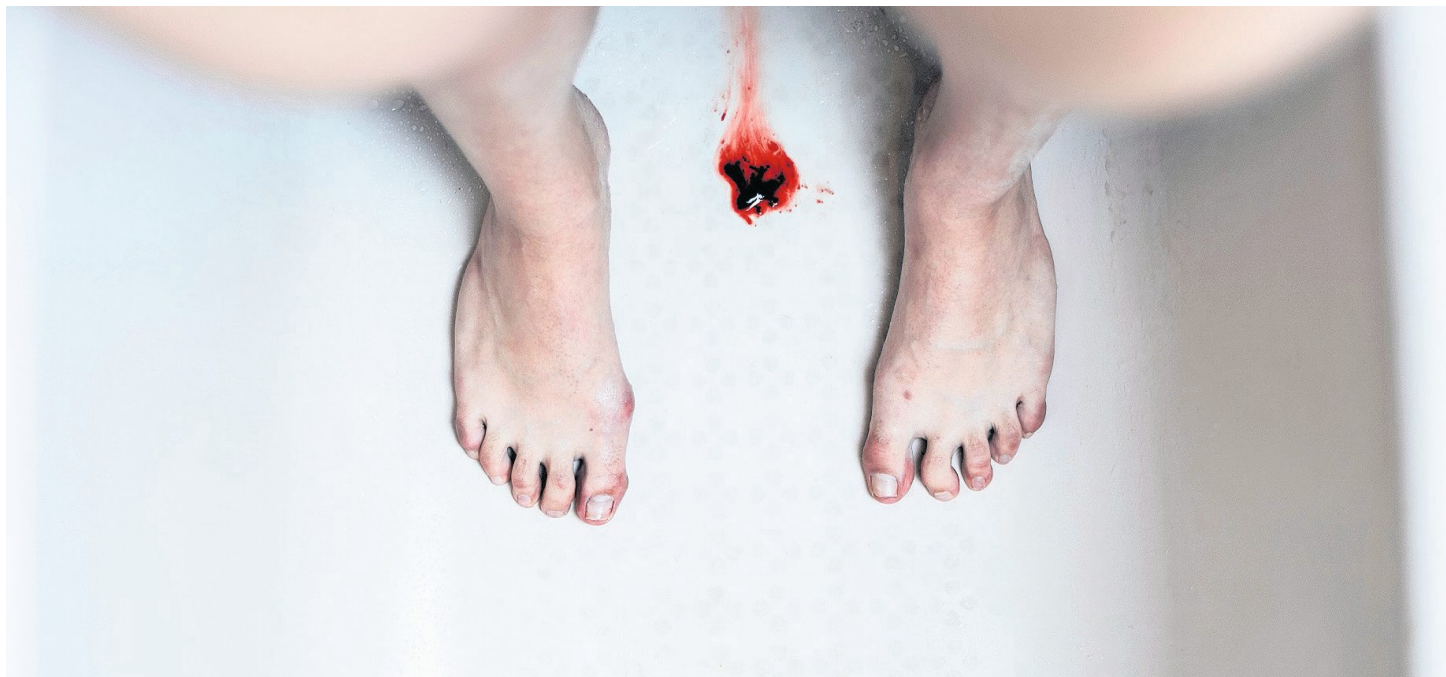
Schluss mit Tampons & Co.: Free-Bleeding-Anhängerinnen lassen das Menstruationsblut einfach rausfliessen..