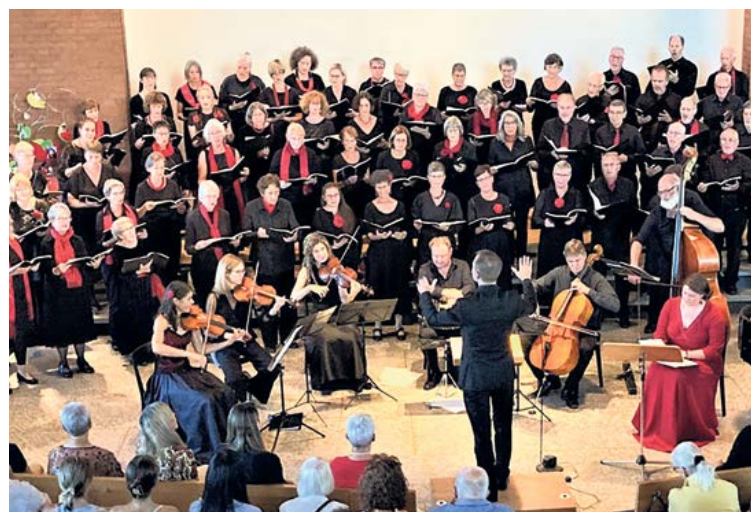
Chorkonzert des Singkreises Bethlehem.

BERN – Zu einem aussergewöhnlichen Konzert lädt der Singkreis Bethlehem und Thun ein. Auf dem Programm steht die äusserst selten aufgeführte Missa di Requiem von Gaetano Donizetti, ein Werk voller klang-