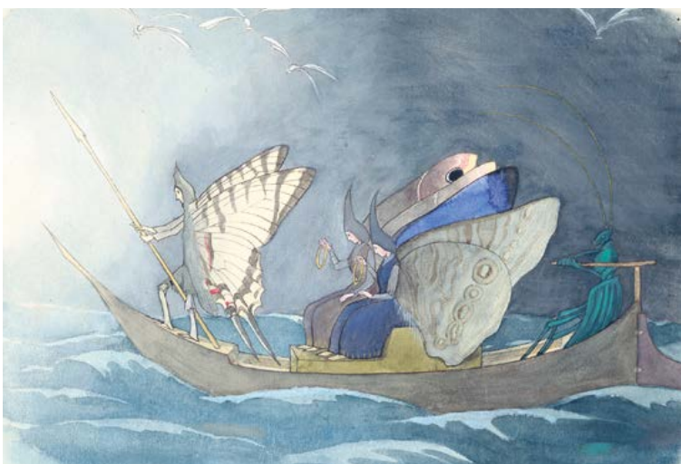
Spannende wie vieldeutige Bilderwelten bei Ernst Kreidolf.

Der Tod im Werk von Maler Ernst Kreidolf