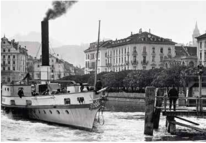
Die «Stadt Mailand» am Schweizerhofquai in Luzern.