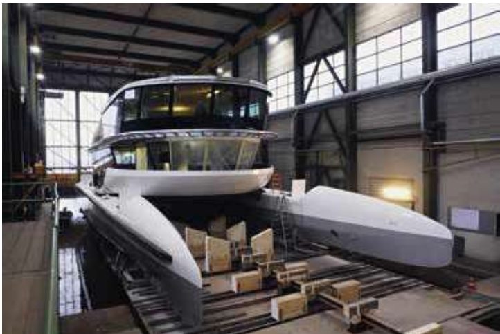
Der neueste Spross der SGV-Flotte: Das MS Bürgenstock beim Stapellauf.