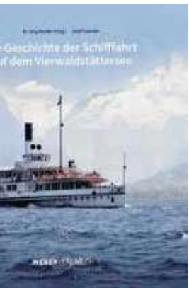
Das Titelbild des neuen Buches.

Mit weitgehend unveröffentlichten Bildern, mit aufwändig recherchierten Texten und mit sorgfältig aufgearbeiteten Daten und Zahlen will dieser neue Band die Schifffahrt auf dem Vierwaldstättersee in den 185 seit 1837 vergangenen Jahren faktentreu, aber auch unterhaltend aufleben lassen. Dank dem elektronischen Zugang in verschiedene Archive, so auch ins Bundesarchiv, konnten neue Quellen erschlossen werden.