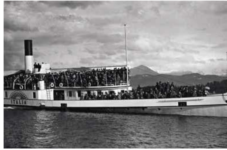
Die «Italia» als Zuschauerschiff zur Ruderregatta in Luzern.

Wir zeigen hier eine Auswahl an Fotos aus dem neuen Buch über die Vierwaldstättersee-Schifffahrt.