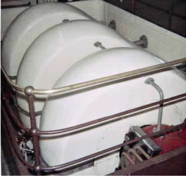
Die Maschine der dritten «Stadt Luzern» war früher mit Blech verschalt.

Wir zeigen hier eine Auswahl an Fotos aus dem neuen Buch über die Vierwaldstättersee-Schifffahrt.