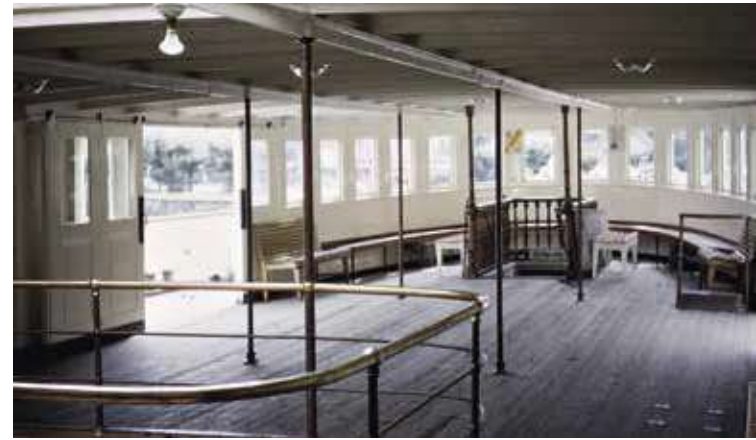
Das Einstiegsdeck (Mittelschiff) des Dampfers Schwyz.