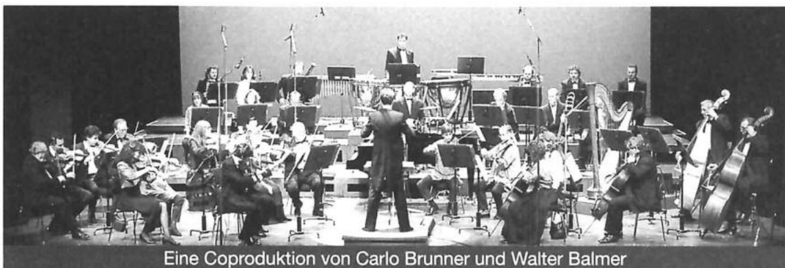
Eine Coproduktion von Carlo Brunner und Walter Balmer