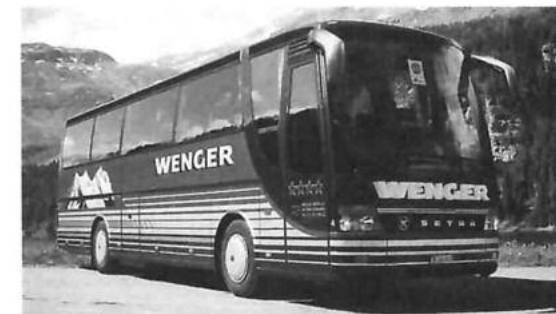
...ein komfortabler Fernreisebus...

Der Vorstand allein oder der ganze Verein – mit Kind und Kegel? – Kein Problem, die Bus-Partner Bödeli haben die richtigen Fahrzeuge für Ihren Bedarf. Im 14plätzigen, klimatisierten Kleinbus reisen Sie genau so bequem wie im 70plätzigen, komfortablen Fernreisebus. Dabei spielt die Grösse Ihrer Reisegesellschaft überhaupt keine Rolle. Sie dürfen gut und gerne tausend Leute auf die Achsen bringen, denn die Bus-Partner Bödeli arbeiten gut zusammen und helfen sich in der Fahrzeugdisposition gegenseitig gerne aus.