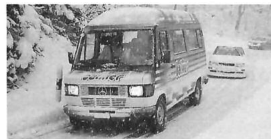
Ob ein Kleinbus...