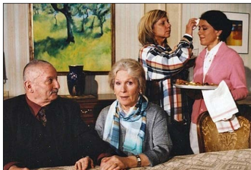
Lüthi & Blanc

«Ich schminkte ihn ein paar Mal für Polit-Anlässe, die teils auch auf Grossleinwand übertragen wurden. Er war sehr charmant und ein Gentleman durch und durch.»