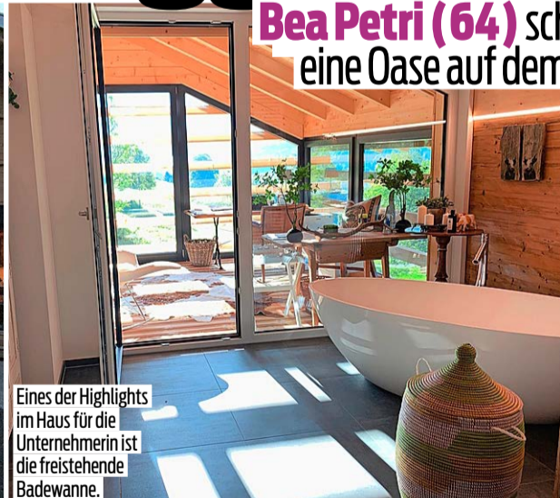
Eines der Highlights im Haus für die Unternehmerin ist die freistehende Badewanne.

Bea Petri (64) schafft sich eine Oase auf dem Land