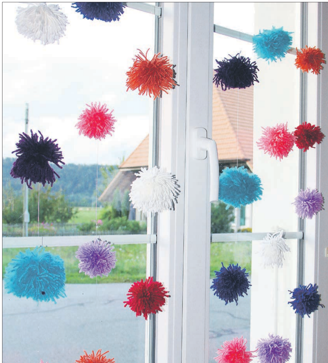
Nach Lust und Laune kann mit den Farben gespielt und die Pompons beliebig aufgezo-gen werden. Dazwischen immer einen Knoten machen, damit sie nicht runterrutschen.

So schreibt denn der Werd Verlag auch: «Entzieht man dem Familienalltag etwas Schnelligkeit,