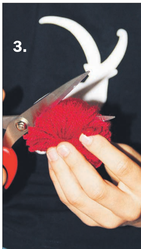
Dominic wickelt die Wolle um ein Stück Karton. Nach dem vorsichtigen Abschieben vom Karton, in der Mitte mit einem reissfesten Faden gut zusammenbinden. Die Schlaufen rundherum aufschneiden, fertig ist der Pompon.