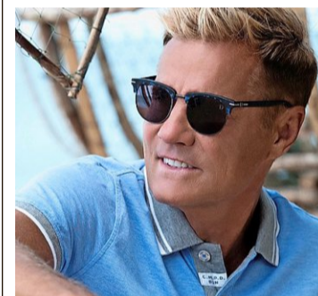
Da hatte er sie noch: Dieter Bohlen mit Sonnenbrille.

Am Samichlaustag 2018 war sie mit ihrem Freund an einem Strand in Thailand, als plötzlich der deutsche Pop-Titan und «DSDS»-Juror – von einem Kamerateam begleitet – auf dem Stand Up Paddle vorbeiruderte. Genauer gesagt, turnte er auf dem Brett herum, bis seine Sonnenbrille ins Meer fiel.