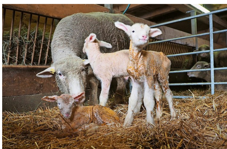
Gleich ein dreifaches Glück im Schafstall.

Kamera fest. Beobachtete die Mäusebussarde, die nach dem Grasmähen ihre Kreise über den Feldern zogen, um Mäuse zu fangen. Schaute den Schmetterlingen und Grashüpfern zu. «Das war wie eine Therapie für mich und hat mir extrem geholfen», sagt sie. Mittlerweile hat sie den Brustkrebs besiegt. Doch seither nimmt sie sich