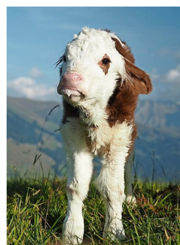
Allerliebst: Ein neugeborenes Kälbli.

Maria Rieder: «Meine Tierwelt – ein Bilderbuch vom Bauernhof», Werd & Weber Verlag. Website der Autorin: www.riederfotografie.ch