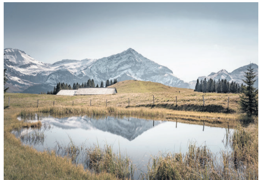
Die Wispile in herbstlicher Stimmung.

Die Zentralschweiz und das Berner Oberland würden im Vorjahresvergleich weiterhin hervorstechen, und auch die Waadtländer und Freiburger Alpen und die Ostschweiz hätten bisher deutlich besser abgeschnitten als im Sommer 2021, schreibt Seilbahnen Schweiz. Das Wallis liege bei den Ersteintritten leicht über der Vergleichsperiode, Graubünden leicht