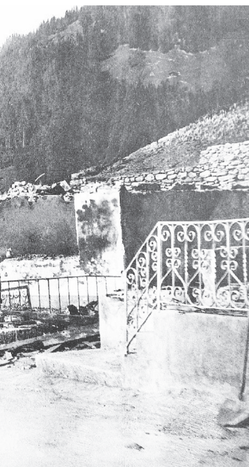
Ruine (Foto Juli 1898).