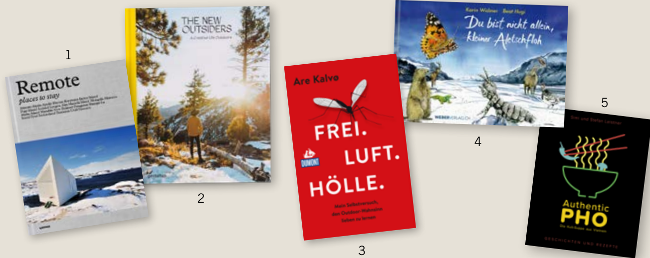
Hannah von Transa Books.

1. REMOTE PLACES TO STAY Mit diesem Bildband besucht der Leser 22 der entlegensten Hotels quer über den Globus verteilt. Mal mit Ausblick über eisige Fjorde und mal mit Wüstenpanorama. Obendrauf gibts Infos über die Ausstattung der Unterkünfte und mögliche Aktivitäten in der Umgebung. «Remote Places to Stay», Die Gestalten Verlag, 978-389955-165-5, CHF 55.90.