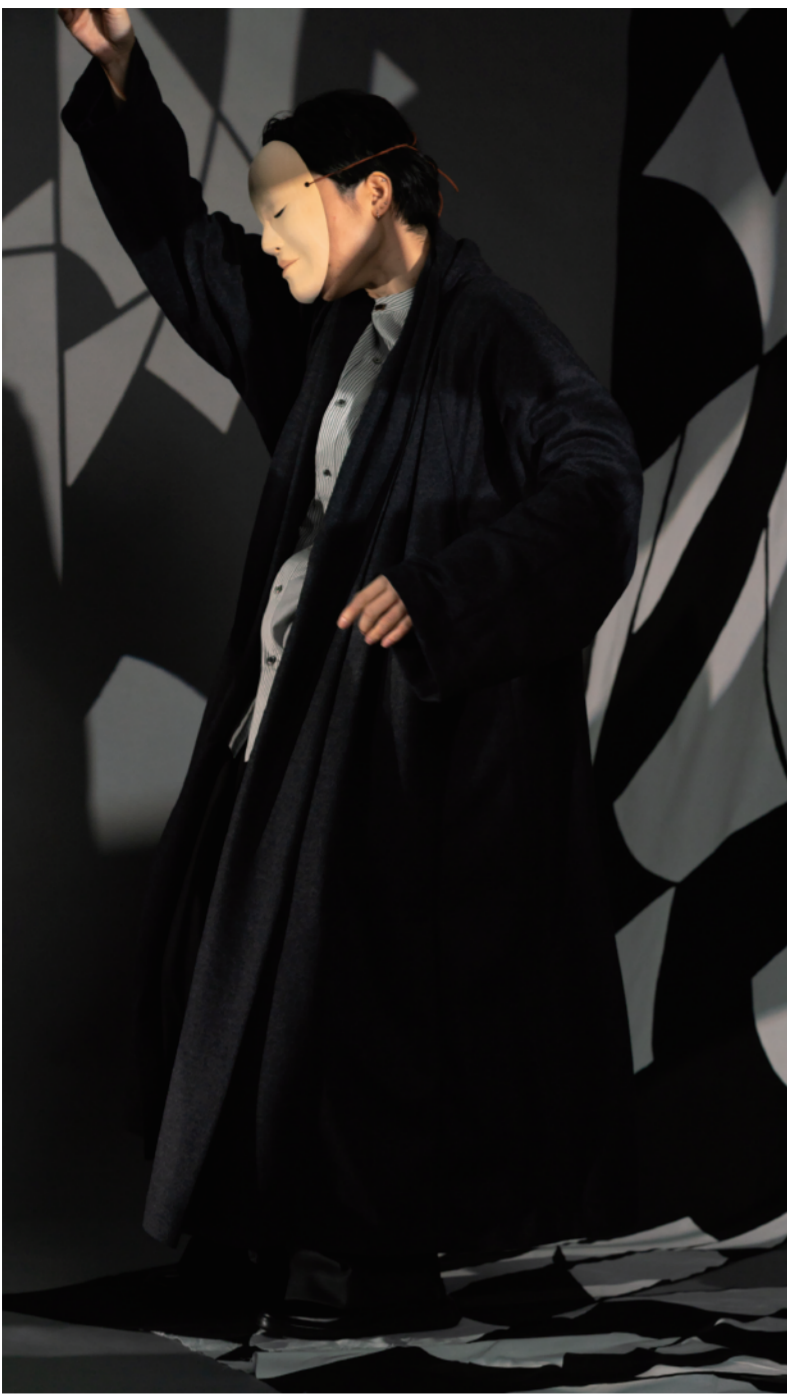
iza_o_2306 ロープ iza_t_2314 ドルマンシャツ