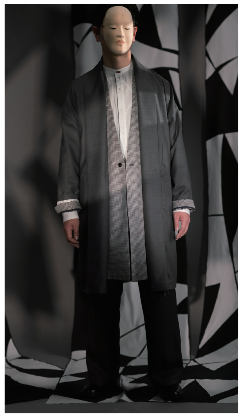
iza_o_2307 羽織 iza_o_2312 ノーカラージャケット