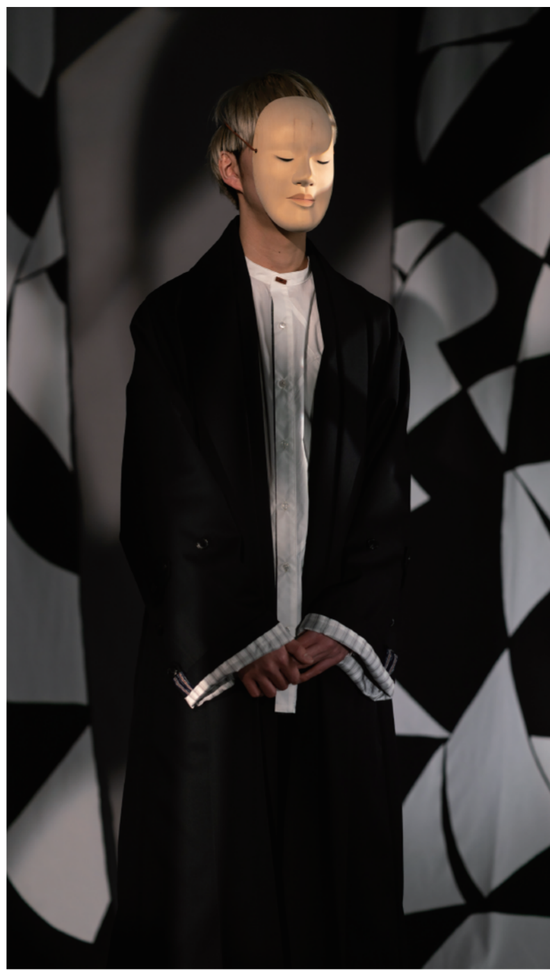
iza_o_2301 外套 iza_t_2315 ドレスシャツ