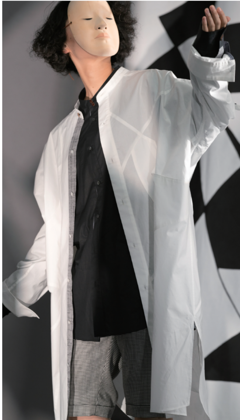
iza_o_2316 ロングシャツ iza_t_2314 ドルマンシャツ iza_b_2328 ハーフパンツ