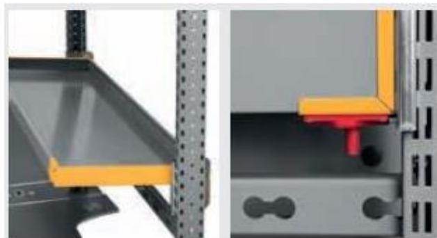
Geopende positie – Te openen met één hand

https://storevannederland.nl/wp-content/uploads/2020/09/Lightshelf DEEN CCT02S2600 web-min.pdf