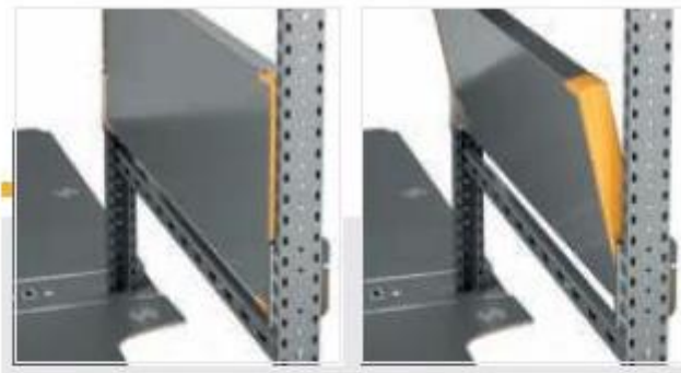
Gesloten positie 1 – Gesloten positie 2