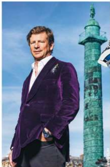
Portrait du joaillier franco-allemand en 2019, par David Atlan.