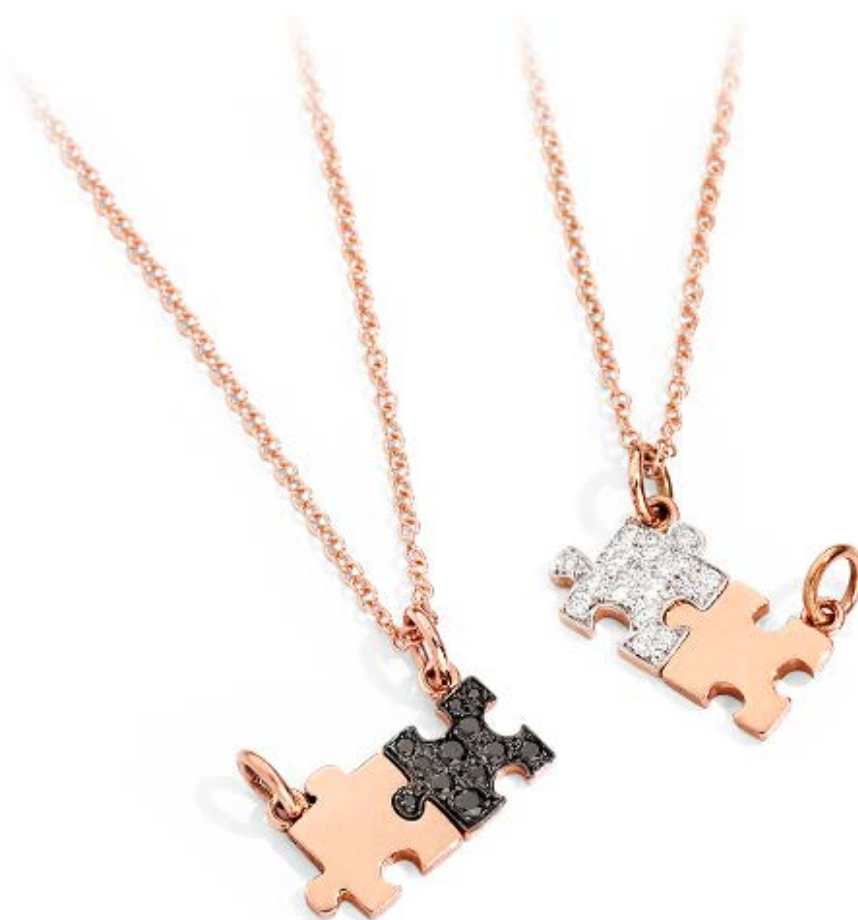
© DODO joaillerie - Nouvelle collection « Puzzle » pour la Saint-Valentin, or rose et diamant

Le paroxysme de la complémentarité est joliment exprimé dans la nouvelle collection du joaillier italien Dodo, intitulée « Puzzle ». Les formes s'imbriquent et se complètent.