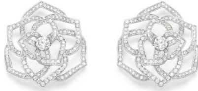
© PIAGET – Boucles d'oreille collection « Rose » en or blanc et diamant