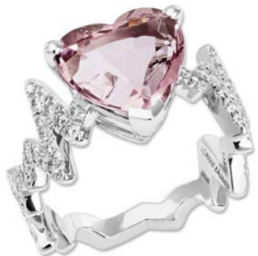
© LORENZ BAUMER : collection « battements de cœur », en or blanc et diamant et un spinelle rose