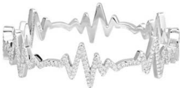
© LORENZ BAUMER : collection « battements de cœur », en or blanc.

Le joaillier contemporain Lorenz Bäumer traduit les mouvements du cœur avec beaucoup d'humour et de subtilité. Bäumer a imaginé un bracelet et une bague où l'on voit les courbes d'un électrocardiogramme en diamant, allégorie d'un cœur vivant au rythme des sentiments.