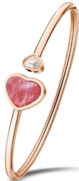
© CHOPARD – Nouvelle collection, jonc en or pierre ornementale et diamant et or rose

Le joaillier contemporain Lorenz Bäumer traduit les mouvements du cœur avec beaucoup d'humour et de subtilité. Bäumer a imaginé un bracelet et une bague où l'on voit les courbes d'un électrocardiogramme en diamant, allégorie d'un cœur vivant au rythme des sentiments.