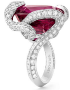
© BOUCHERON – Bague « Kaa, le serpent », or blanc habillé de diamant (288) et d'une rubellite, le désir incarné, haute joaillerie