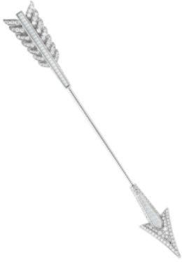
© BOUCHERON – Flèche à piquer en or blanc et diamant

Aussi, on peut « piquer » d'amour l'être aimé en le parant d'un bijou précieux qui rappelle le fameux Cupidon ; ce dernier envoie une flèche pour attraper le cœur de l'autre. Pour cela, Boucheron a créé littéralement une flèche en diamant. Enfin, le symbole précieux peut être doux comme les fleurs (voir la collection « Rose » de Piaget) ou même un peu plus coquin et rappeler le péché originel et le désir (voir la bague « Serpent » de Boucheron). Précieusement, il y en a pour tous les cœurs.