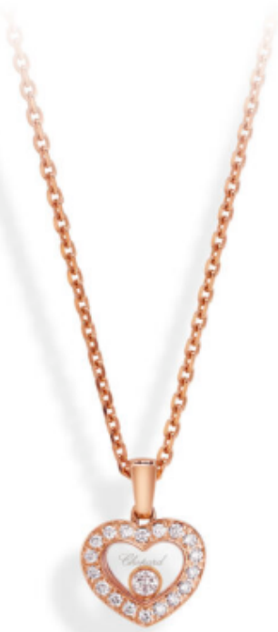
© CHOPARD – Pendentif en or rose et diamants mobiles collection iconique « Happy diamonds »