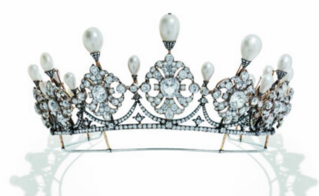
Le diadème Fürstenberg chez Christie's