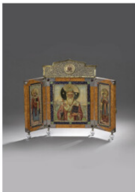
Collection éclectique et étonnant chez De Baeque