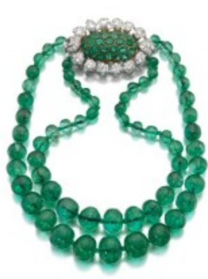
Parure d'émeraudes de la philanthrope Lily Safra chez Sotheby's