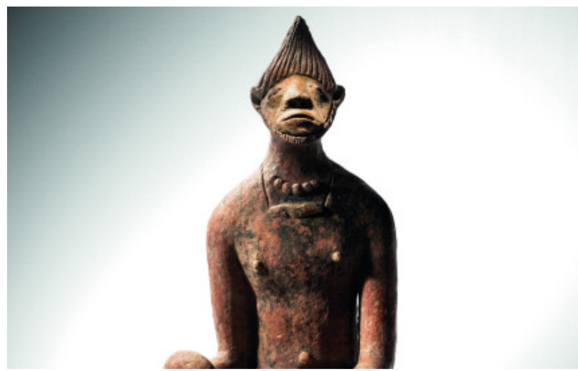
Mystérieuse sculpture djenné chez Christie's