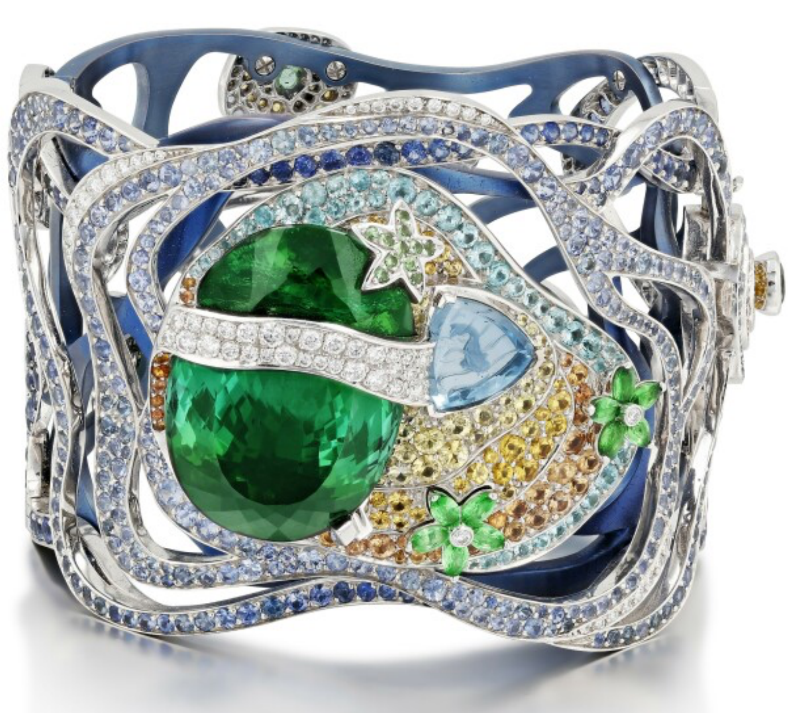
Bracelet Île au trésor de Lorenz Bäumer.

Le bracelet Île au trésor est à découvrir parmi les objets de la collection de Lorenz Bäumer mis en vente chez Sotheby's.