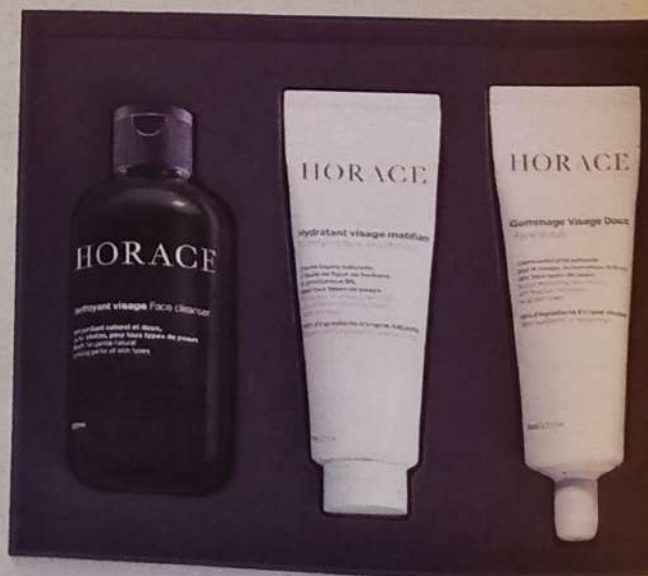
1. DVD « Un monde nouveau », série documentaire de Cyril Dion, ARTE ÉDITIONS, 20 €. 2. Bague Battement de Cœur, or et diamants, BÄUMER VENDÔME, 4 000 €. 3. Montre Rendez-vous Shooting Star, fond saphir, diamants, bracelet cuir et or, JAEGER-LECOULTRE, prix sur demande. 4. Chaise pliante Ika, bois et cuir, ONDARRETA, 420 €. 5. Coffret de Noël soins de visage, HORACE, 36 €. 6. Platine vinyle Chroma, bouleau et cuir, ELIPSON & BLEU DE CHAUFFE sur Son-video.com