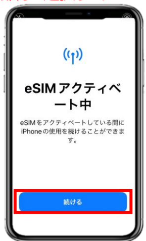
4. 「続ける」を選択してください。