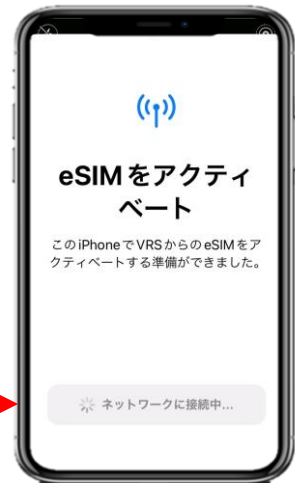
3. 「続ける」を選択してから少しお待ちください。