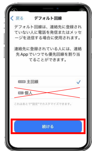
5. デフォルト回線は主回線を選択してください。 ※「個人」が今回のeSIMであるため現地で利用開始するまでは主回線を選択。iPhoneによっては表記が異なる可能性があります。