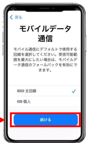
6. 引き続き主回線を選択するとインストール完了です。