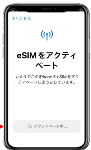
2. 「続ける」を選択してから少しお待ちください。