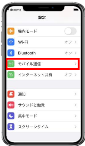
1. 「設定」アプリを開き、「モバイル通信」を選択します。