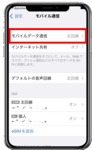
2. 「モバイルデータ通信」を選択し、「個人」を選んでください。 ※iPhoneの設定によっては表記が異なる可能性があります。