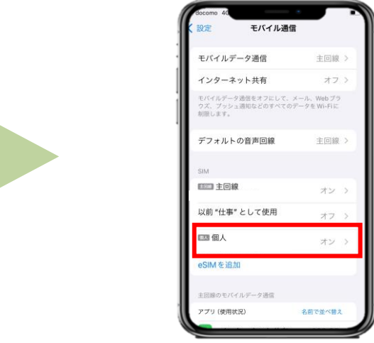
3. 「モバイル通信」に戻り、SIMの「個人」(今回のeSIM)を選択してください。