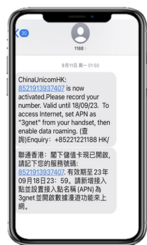
6. eSIMが有効化されると上記のSMSが届きます。

※ご自身が普段日本で利用している主回線のデータローミングが無効(灰色)になっていることを確認してください。 海外で日本の回線がローミング設定がオンの状態で、高額のパケット料金が請求される恐れがありますので、ご注意ください。