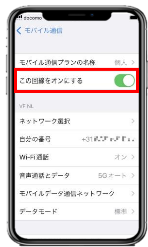
4. 「この回線をオンにする」が有効化(緑色)になっていることを確認します。