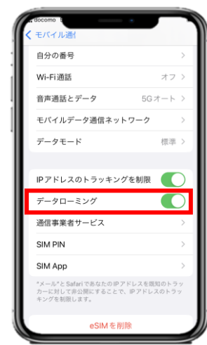
5. 「データローミング」を有効化(緑色)します。