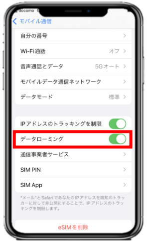
5. 「データローミング」を有効化(緑色)します。