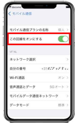
4. 「この回線をオンにする」が有効化(緑色)になっていることを確認します。