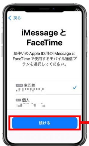
6. 引き続き主回線を選択するとインストール完了です。