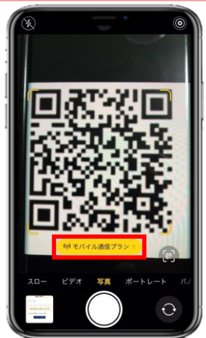
1. 購入後に表示されるQRをiPhoneの「カメラ」アプリで読み込む。 赤枠の部分を選択します。

※eSIMに対応するSIMロックフリーまたはSIMロック解除済み端末のみご利用いただけます。 ※eSIMを一度削除すると再インストールはできません。 本利用ガイドはiOSバージョン16.1.2の画面を使用しております。