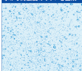
水から高濃度のオゾンを生成

1μm=1/1,000mm [ファインバブル(マイクロバブル)]:直径10-100μm