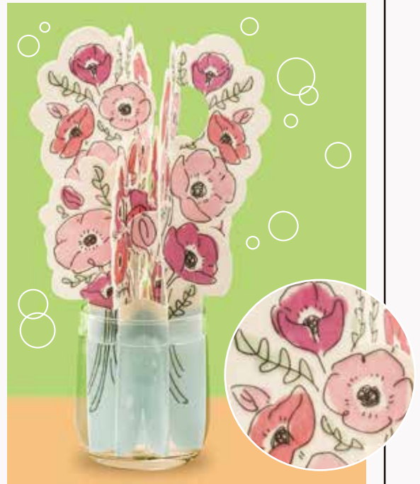
※写真・イラストはイメージです。※コップはついておりません。